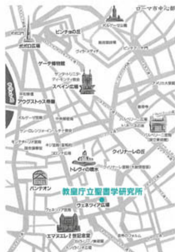
「世界の都市の物語 5ローマ」より 本館・花川館所蔵 209/Se22/5

1979年から数年、ローマはベネツィア広場とトレビの泉の間にある「教皇庁立聖書学研究所」(Pontificio Istituto Biblico)というところで聖書の勉強をしていました。一昨年の暮れ、NHKの特集番組「キリスト生誕2000年」に、この研究所の図書館が写し出されており、なつかしく見ました。蛇足ながら、キリスト生誕に関しては計算の誤差があり、実際は紀元前6～3年の間であったであろうとされています。この研究所は教皇庁の依頼を受け、1909年にイエズス会が設立したもので、今年には創立90周年にあたり、5月の初めに記念のシンポジウムが開催されました。